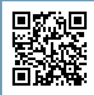
Giới thiệu ví dụ